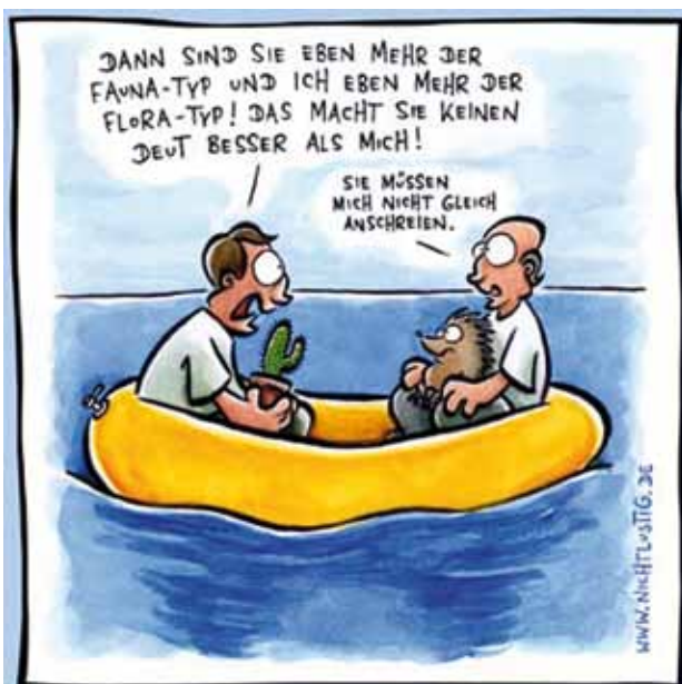
Zeichnung: Joscha Sauer