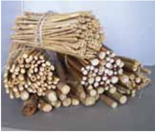
Abb. 3: Gebündelte Abschnitte von allerlei trockenen Stängeln.