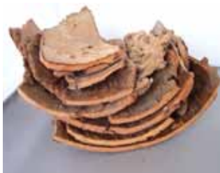
Abb. 6: Ein Rindenstapel. Man muss ein bisschen herumprobieren, bis die Rindenstücke möglichst eng aufeinander liegen.

lunder, Malven. Aber auch Maisstängel, Haselnussruten, Äste aller Art und Dicke kann man für ein Insektenhotel brauchen (Abb. 3).